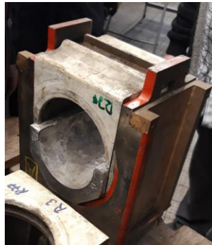
Achslagerschale (eingebaut wird das Lager um 180 Grad gedreht)